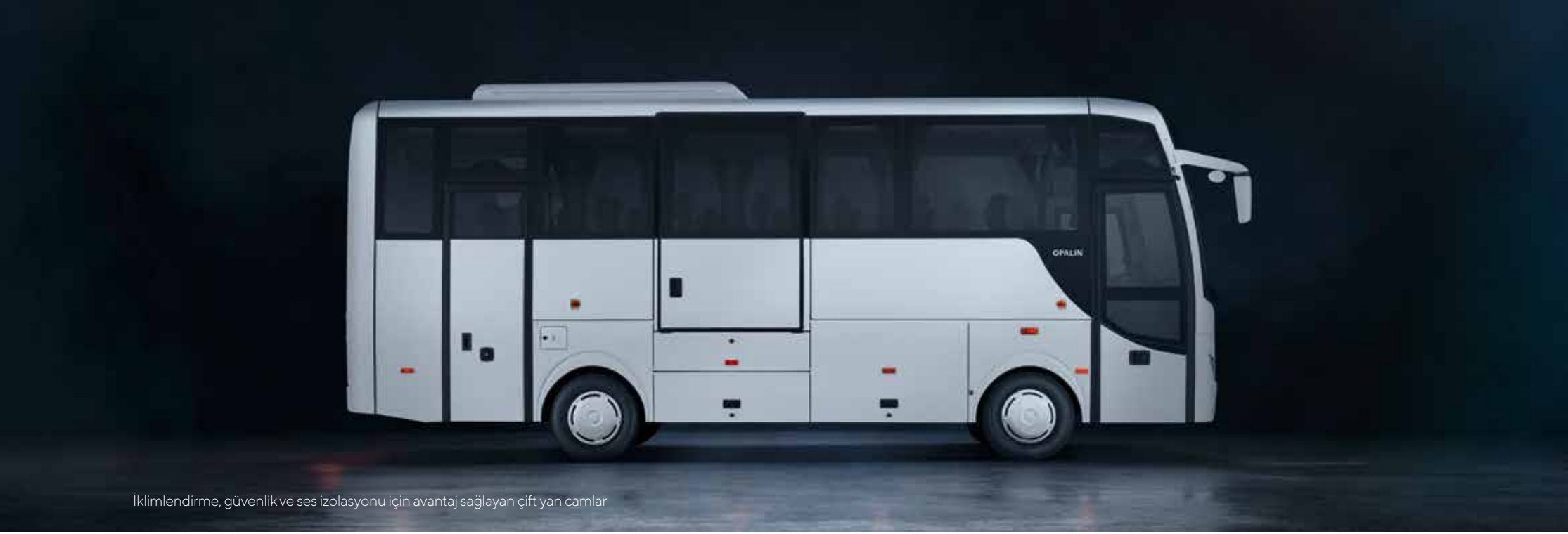
İklimlendirme, güvenlik ve ses izolasyonu için avantaj sağlayan çift yan camlar

lift opsiyonu ile de engelli yolculara güvenli ve konforlu bir seyahat sunuyor.