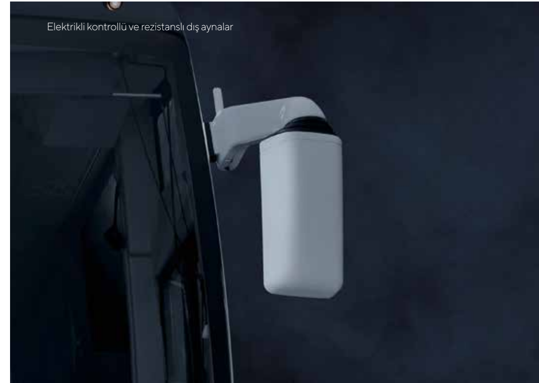
Elektrikli kontrollü ve rezistanslı dış aynalar