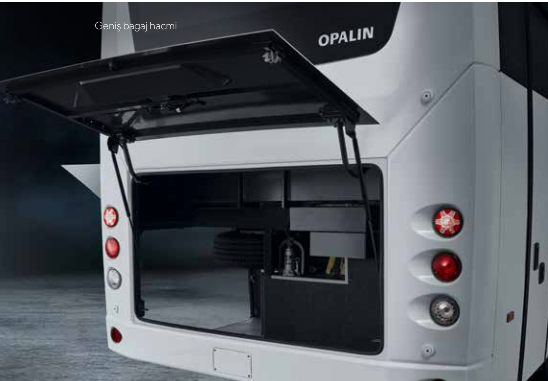
Geniş bagaj hacmi